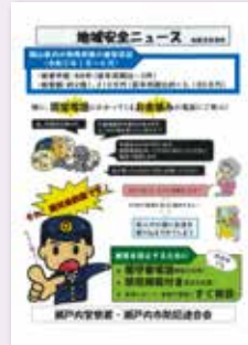
瀬戸内市防犯連合会