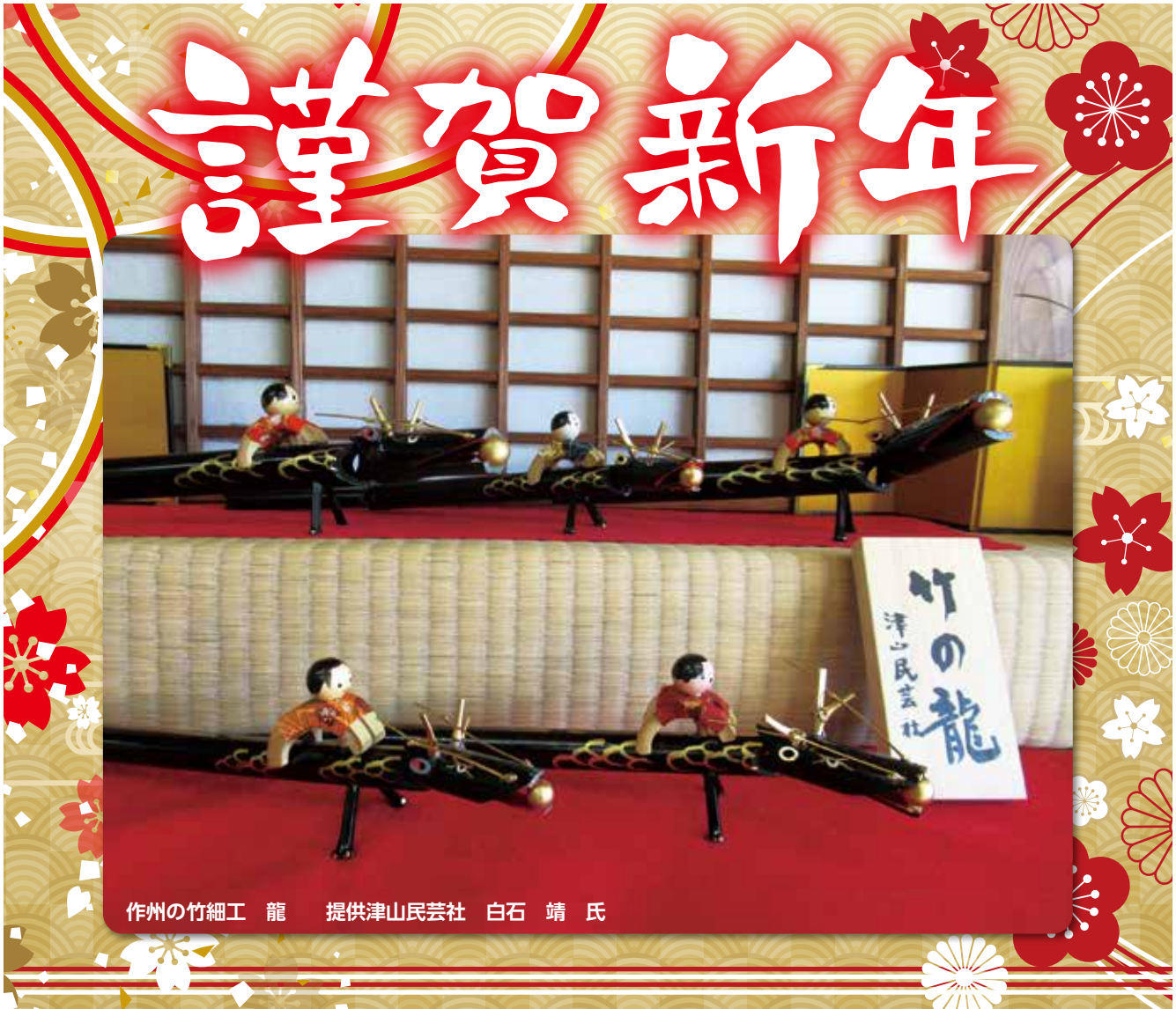
作州の竹細工 龍

「防犯おかやま」は、岡山県防犯協会のホームページ( https://www.obouhan.com )でも閲覧(印刷)できます。