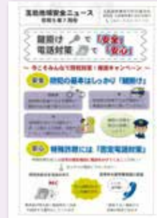
玉島警察署管内防犯連合会