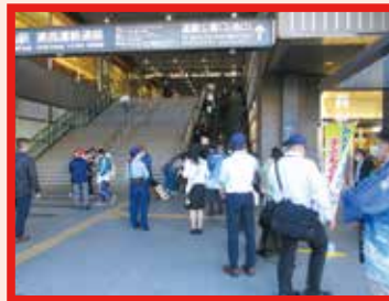
生活安全企画課、岡山中央署 岡山西署