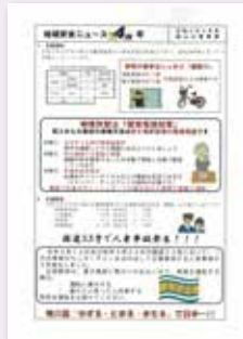
岡山北防犯連合会